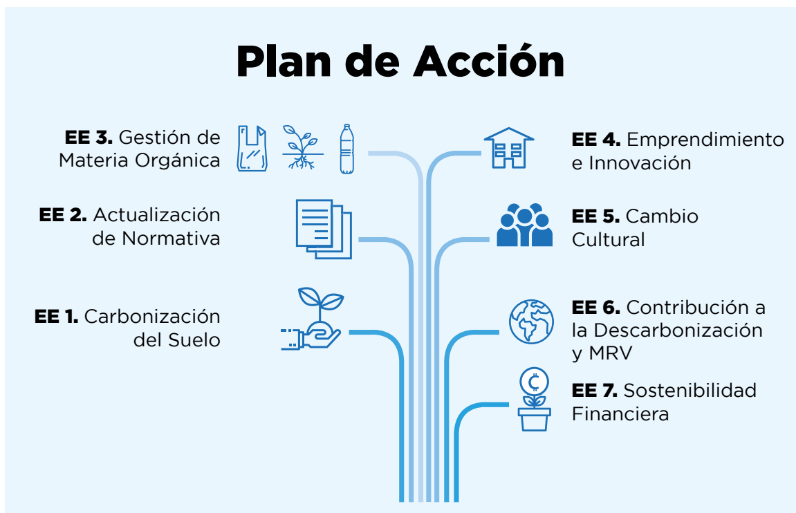
Imagen 1: Los Siete Ejes Estratégicos del Plan Nacional de Compostaje

La sistematización de la información recopilada en el Primer Conversatorio permitió al Equipo Técnico de Compostaje, establecer siete ejes estratégicos para la consecución del objetivo del Plan Nacional de Compostaje; estos ejes son: